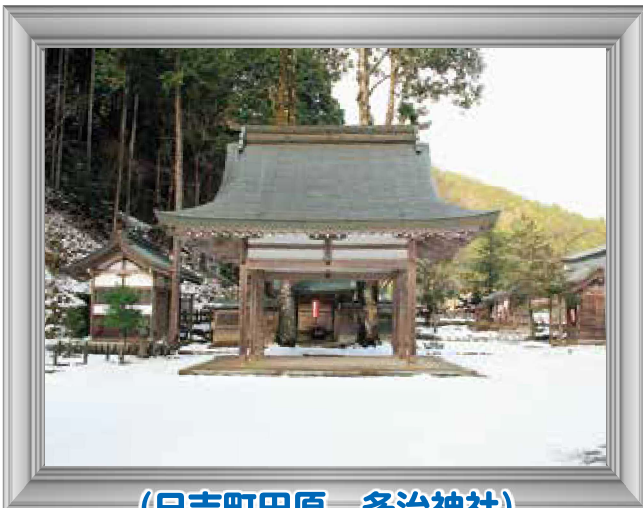
(日吉町田原 多治神社)