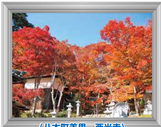
(八木町美里 西光寺)