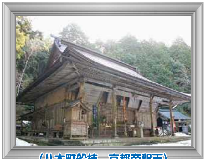
(八木町船枝 京都帝釈天)