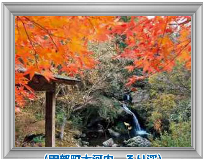
(園部町大河内 るり溪)