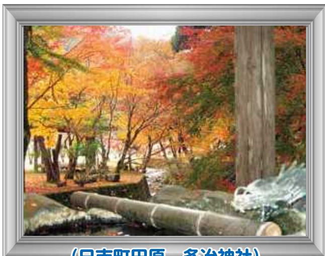
(日吉町田原 多治神社)