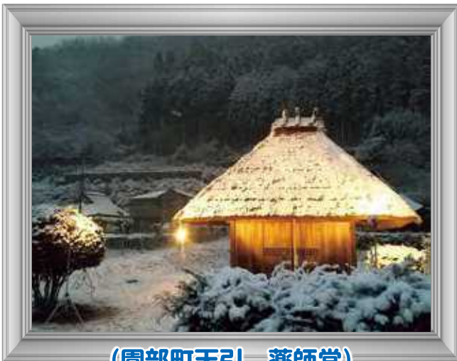
(園部町天引 薬師堂)