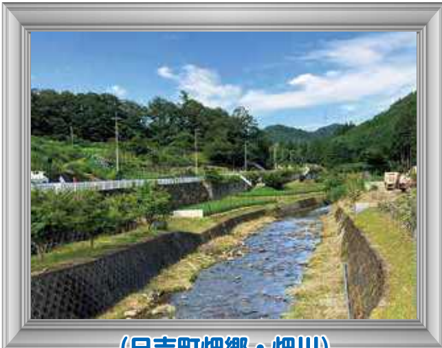
(日吉町畑郷・畑川)