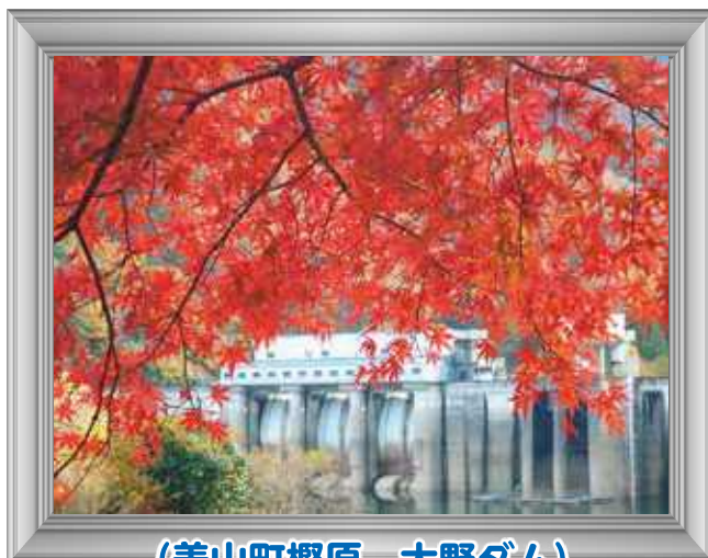
(美山町檜原 大野ダム)

問い合わせ先 地域振興課 Tel (0771) 68-0019 美山支所総務課 Tel (0771) 68-0040