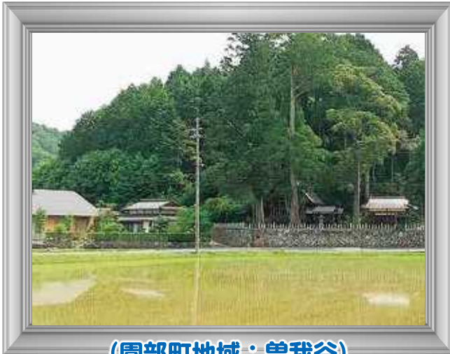
(園部町地域：曾我谷)