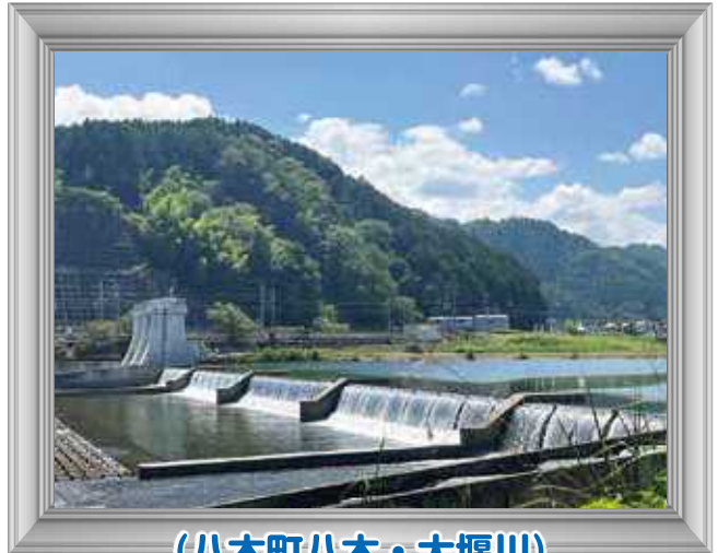
(八木町八木・大堰川)