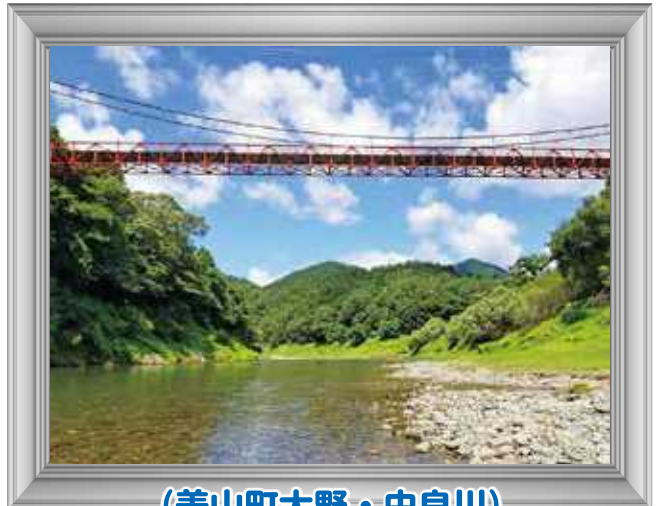
(美山町大野・由良川)

問い合わせ先 地域振興課 Tel(0771)68-0019 美山支所総務課 Tel(0771)68-0040