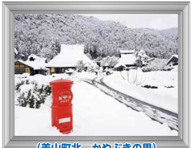
(美山町北 かやぶきの里)

問い合わせ先 地域振興課 Tel (0771) 68-0019 美山支所総務課 Tel (0771) 68-0040