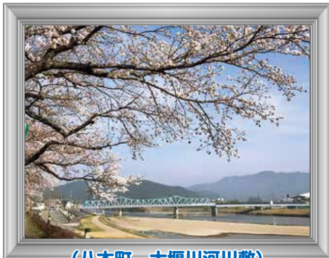
(八木町 大堰川河川敷)