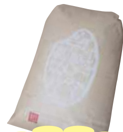
米袋は松崎農園のオリジナルデザイン!

就農して4年経ちますが、なかなか思うように栽培できず、頭を悩ませていることも多いですが私の栽培した農産物を食べて「おいしい」「ありがとう」など喜んでもらえることにやりがいを感じています。