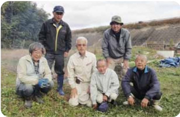
▲竹炭友の会の会員のみなさん