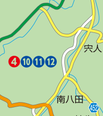
10 辻田 榮治