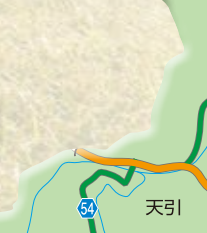
12 中面 一美