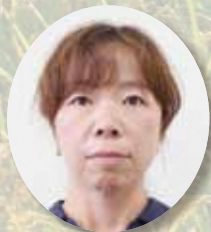
7 みさき 三崎 まさこ 正子