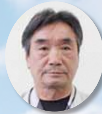
5 ながの 長野 さとし 敏