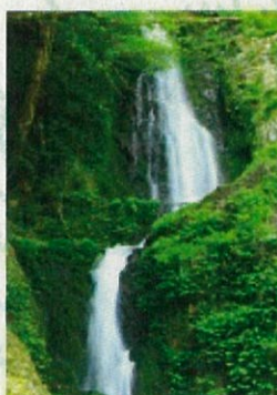
マイナスイオンを浴びに みんなで「音谷の滝」へ