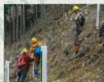
カブトムシが 集まる木クヌギ 「植栽」