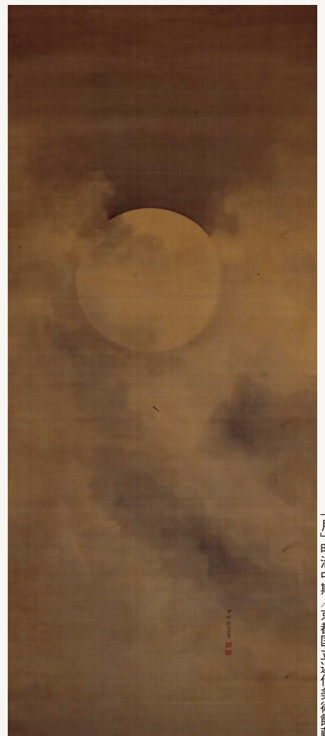
「月」明治中期／京都国立近代美術館蔵