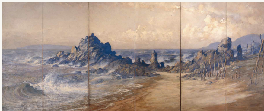
「越後海岩図屏風」明治36年／京都国立近代美術館蔵