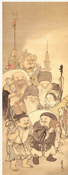
「七福神図」明治31年／星野画廊蔵