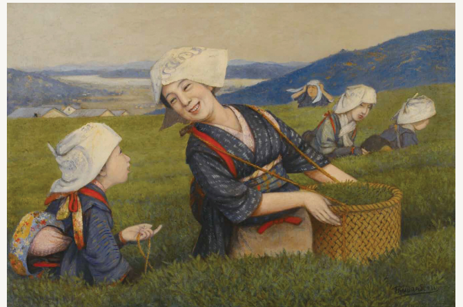
「茶摘之図」明治13年頃／仁和寺蔵