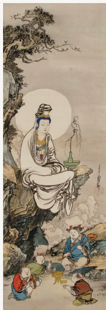
「観音図」制作年不詳／豊中不動寺蔵