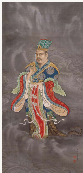
「善女竜王」明治後期／京都国立博物館蔵