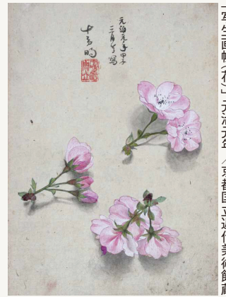
「写生画帳(花)」元治元年／京都国立近代美術館蔵