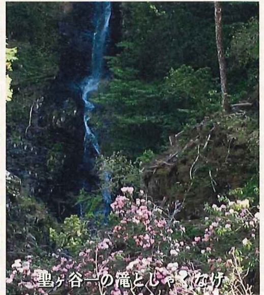
聖ヶ谷一の滝とじゃくなげ