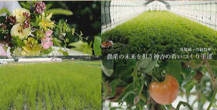
京都唯一の栽培率 農業の未来を担う神吉の若いづくり手達

神吉は、人懐っこい話術が魅力。人懐っこい。親戚付き合いのよさな町で、移住してきたことのない、子どもを大切に育てていける土地柄で、お子さんの小学校の運動会にお父さんかお母さん、おじいちゃん、おばあちゃんも参加していたことを印象深く話された。