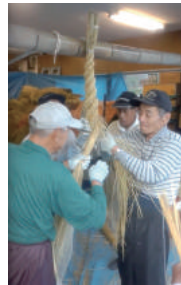
伏見稲荷大社のしめ縄