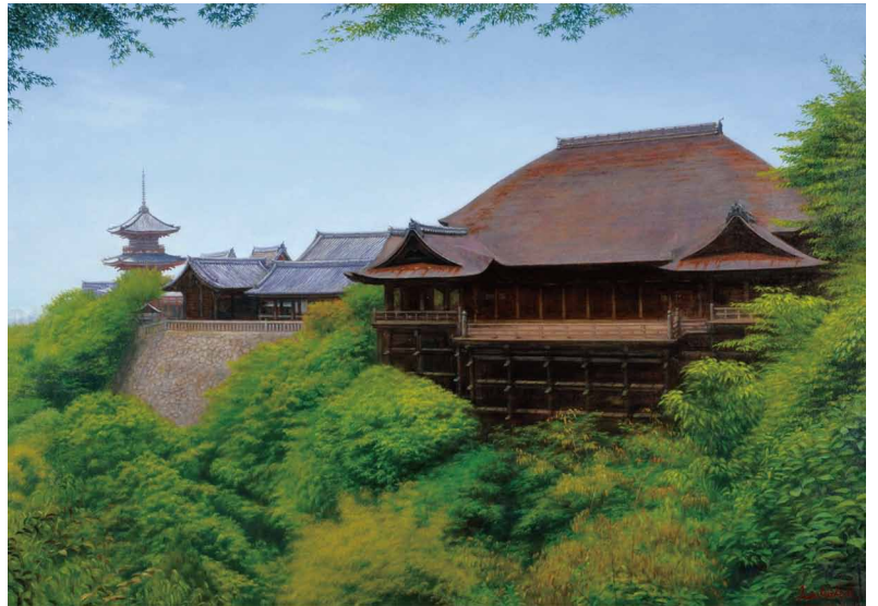
「新緑の清水寺」2015年<京都市東山区>※