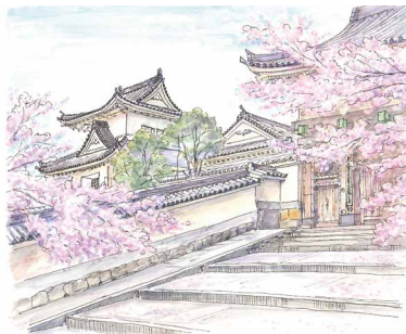
「春・園部城跡」2016年<南丹市園部町>※

【交通案内】◆自動車…京都縦貫自動車道「園部IC」もしくは「八木西IC」より約5分。 ◆電車・バス…JR 園部駅西口より京阪京都交通バス「八田線」もしくは「園籬線」に乗車、「交流会館前」下車すぐ。または、市営ぐるんバスに乗車、「図書館前」下車すぐ。