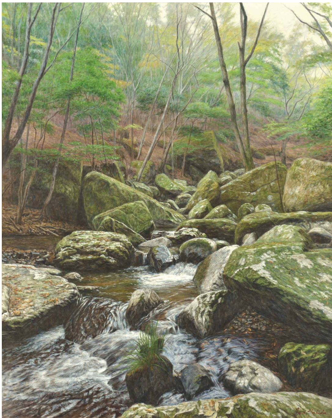
「瀬音」2014年（南丹市園部町・るり溪※）