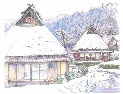
「美山かやぶきの里」2016年<南丹市美山町>※