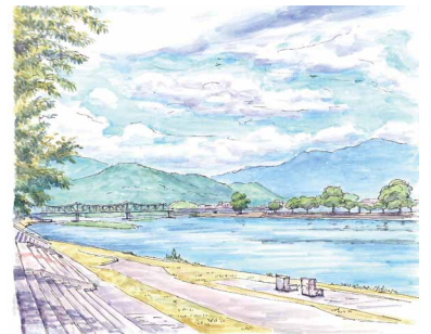
「八木大橋あたり」2016年<南丹市八木町>※