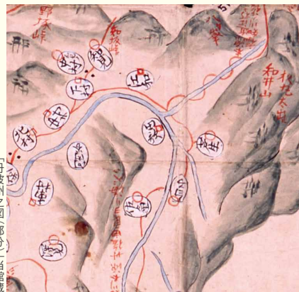
「丹波州之図(部分)」当館蔵