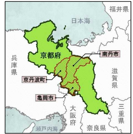
図 開催地域位置図

開催時期は2026(令和8)年の9月中旬～11月上旬をコア期間とし、コア期間以外でも、京都丹波地域の様々な歳時と積極的に連携し、地域の魅力を伝えていく