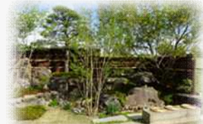
コスモス園と連携した華やかな修景の中で多彩な提案に触れ、学ぶことができる出展を展開