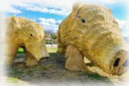
日本の原風景の美しさを伝える展示や農の価値を再発見するためのコンテンツを展開