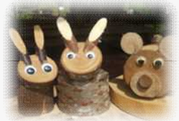
京都丹波地域の豊かな植物と、心を豊かにする文化・芸術とが融合した展示や山野草をテーマにしたコンテンツを展開