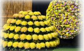
京都丹波地域の眺望を楽しむ場や、高い園芸技術に触れ、学ぶことができる出展を展開