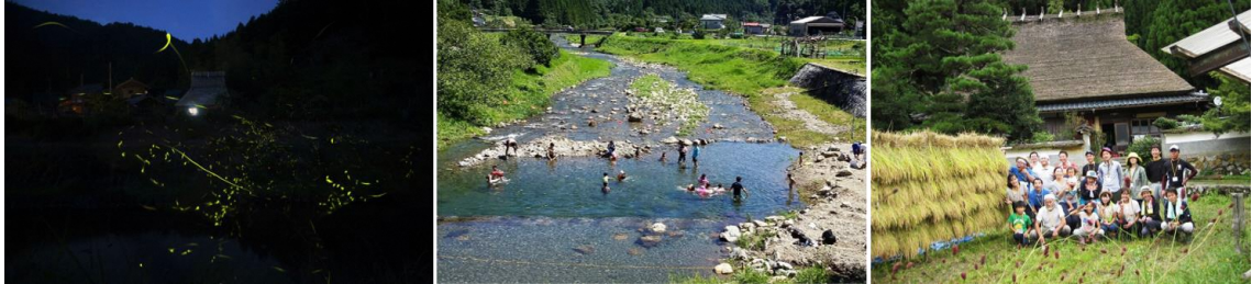
写真は左から、蛍鑑賞ツアー、川遊び、稲刈り体験

また、美山鶴ヶ岡エリアの暮らし文化を知り、より深く地域を楽しんでいただくための体験プログラムの提供も予定しております。