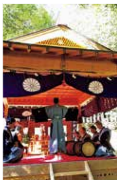
▲伝統芸能「からす田楽」とご神木「大ケヤキ」

これらの文化財を活用し、檜原区を訪れる人口を増やすとともに、来訪者との交流を通じて住民が元気になること、住みたいと思う人が増えることをめざしています。