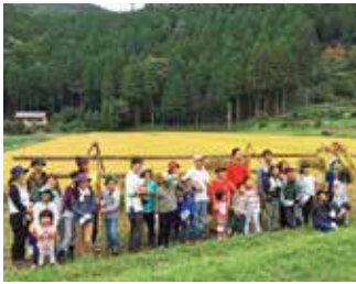
▲農業体験「未来共育学園の生徒と保護者」

チーム編成とさまざまな行事の企画により、集落内に絆が生まれ、誇りと自信が芽生えはじめています。