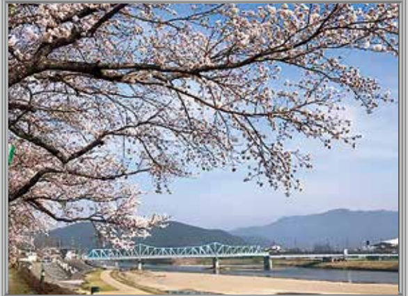
八木町地域 大堰川緑地公園