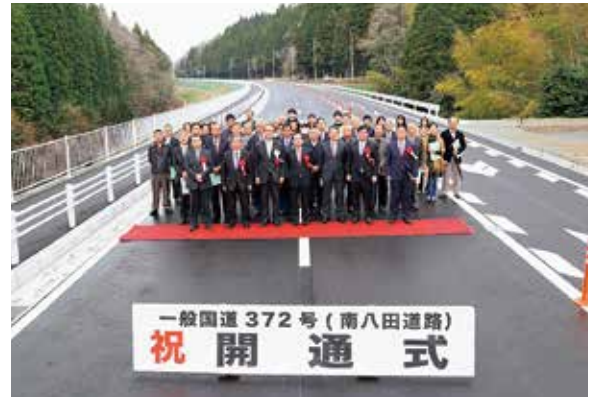
▲完成した道路で記念撮影をする式典参加者

3月28日、一般国道372号、南八田道路の開通式が行われました。式典では、地元の旧西本梅小学校卒業生で構成された、西本梅太鼓クラブがオープニング演奏を披露し会場を盛り上げました。