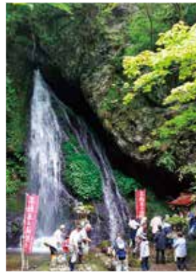
▲伝統行事「不動尊の滝祭り」

毎年6月28日には「不動尊の滝祭り」を開催し、伝統食をはじめとするさまざまな技術の継承に注力しています。