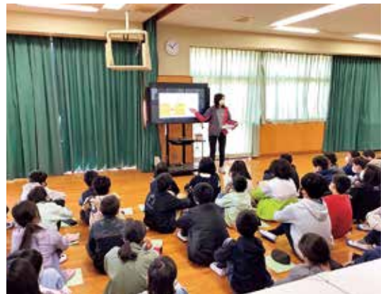
▲昨年度導入した大型提示装置を使った授業