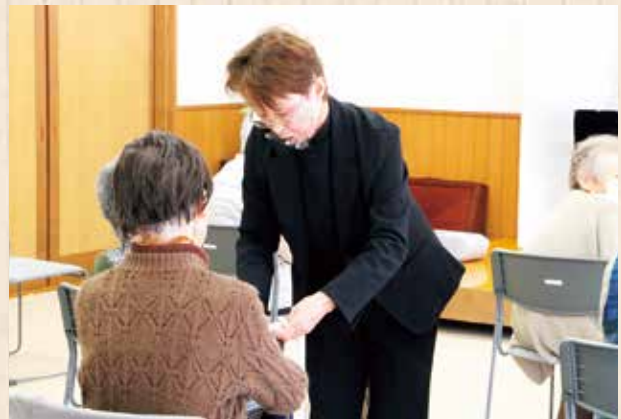
▲手品を参加者に手伝ってもらうことで場を盛り上げます。

「まちカフェモーニングの会」は日吉町の上胡麻・広野・畑郷・東胡麻・西胡麻などの住民たちが集い、交流できる場所を作りたいとの思いから、一昨年に発足。8名の運営委員が中心となり、誰でも参加できる「まちカフェサロン」を開催されています。当初は胡麻駅内の胡麻屋で開催されていましたが、昨年は新型コロナウイルス感染症拡大による中止の時期を経て、現在広めの会場に場所を移し、活動を再開されています。