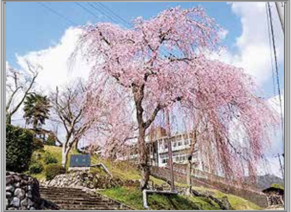
美山町地域 大野地域活性化センター