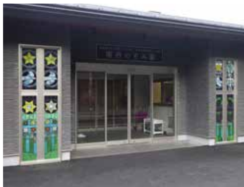
◀南丹のぞみ園正面外観

幼稚園と保育所の機能をあわせた民間の幼保連携認定こども園「南丹のぞみ園」が4月に開園します。