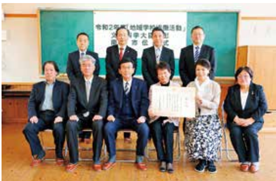
▲記念撮影をする受賞者と関係者

美山地域では、小学校再編以降、地域と学校、保護者が一緒になり、子どもたちの学びについて考え、地元の歴史や文化などを教材とした「美山学」の学習をはじめとしたたくさんの取り組みが行われてきました。