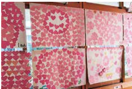
▲そのにつ子のかがやきが笑顔の花を咲かせています。

達のかがやきを見つめる事でも、互いの個性や価値観の違いにも気づき、自他共に尊重する心が育ちます。「そのにつ子」一人一人の良さがさらにかがやくよう育んでいきます。