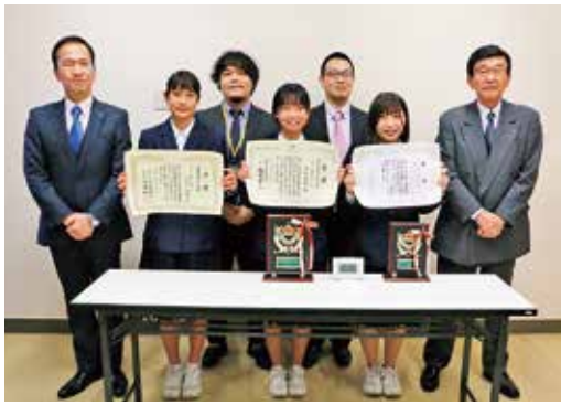
▲表彰状を手に記念撮影する生徒ら