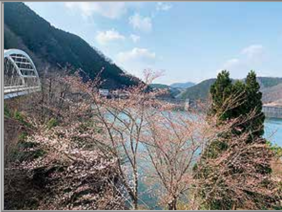
日吉町地域 日吉ダム周辺