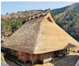
▲茅葺屋根の葺き替えが終了した石田家住宅

された大原神社には「京都自然200選」に選ばれたご神木の「大ケヤキ」があり、その樹齢は千年を超えます。