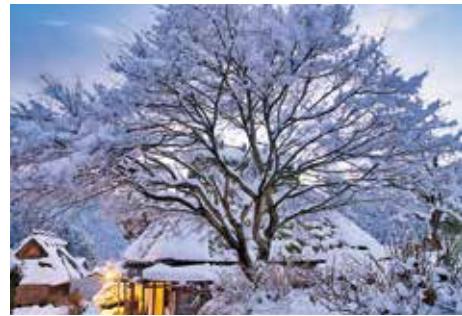
▲京都府知事賞作品「静かに染まる雪の花」

「ええとこ南丹 撮ってきて!」をテーマとして南丹市の景色・文化財・食などの写真を募集し、261作品もの応募がありました。前回に比べ応募点数は少なくなりましたが、コロナ禍の中、撮影に出かけるのも困難な状況にあったにもかかわらず、多くの力作が応募されました。