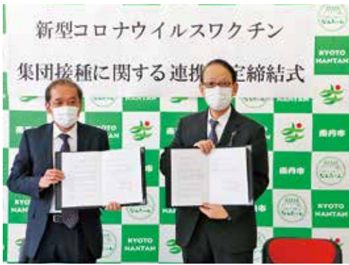
▲協定書を手に持つ蓮本園長(左)と西村市長(右)

3月23日、南丹市役所で、新型コロナウイルスワクチン集団接種に関する連携協定締結式が行われました。