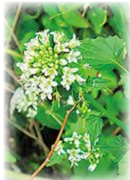
▲裏庭に咲くワサビの花