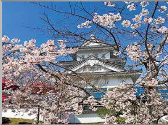
園部町地域 園部公園