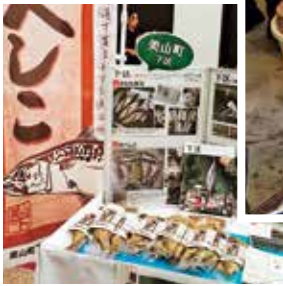
▲特産品「鯖のへしこ」