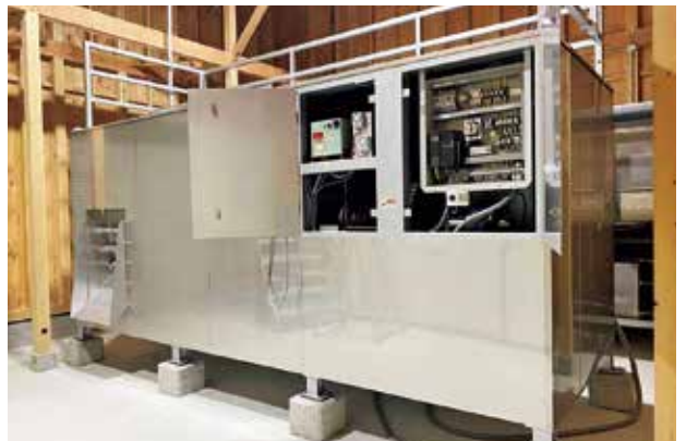
▲昨年度導入した鳥獣減容化装置

国や府の制度の対象とならない認定農業者や集落営農組織への機械導入などに対する支援を行います。