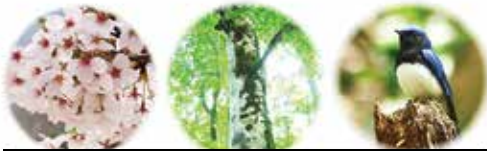
市の花 さくら 市の木 ふな 市の鳥 オオルリ

●総人口：30,870人(-57) (男：15,016人・女：15,854人) (-21) (-36) ●世帯数：14,188世帯(+41) (令和3年4月1日現在) ( )内は前月比