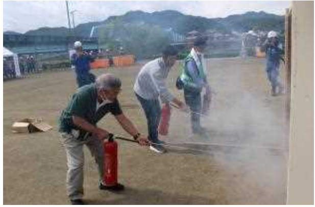
大規模火災訓練・一斉放水