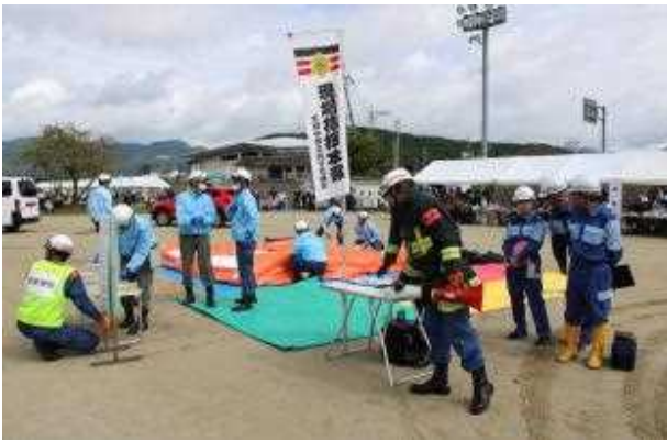
災害医療チーム等派遣訓練