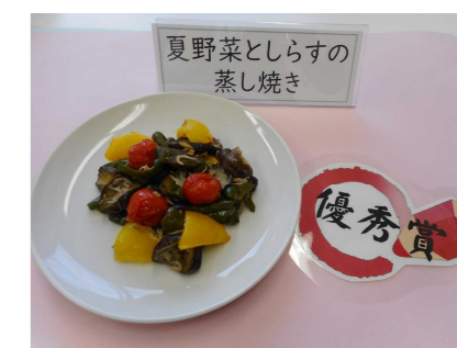
「夏野菜としらすの蒸し焼き」