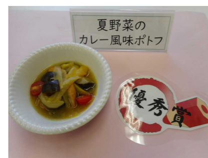
「夏野菜のカレー風味ポトフ」