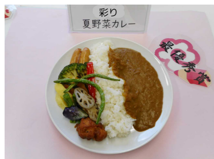
「彩り夏野菜カレー」