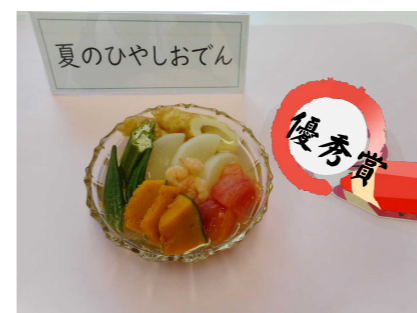
「夏のひやしおでん」