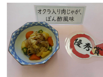
「オクラ入り肉じゃが、 ぽん酢風味」