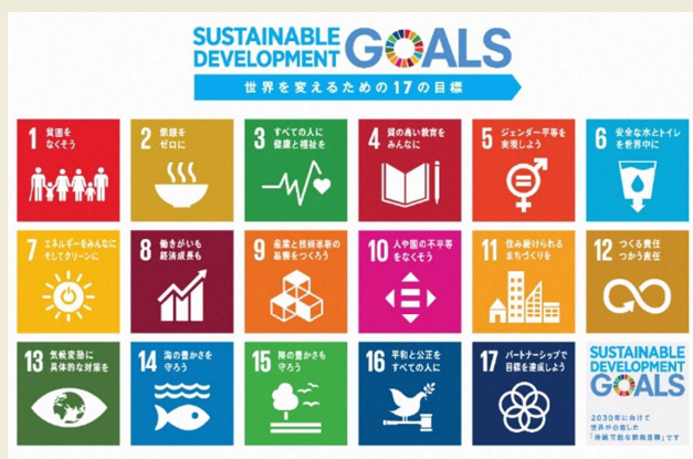
資料:国連広報センター「持続可能な開発目標(SDGs)」

SDGsとは、平成27年9月に国連サミットで採択された、持続可能な世界を実現するための17の目標と169のターゲットで構成される国際社会共通の目標のことです。