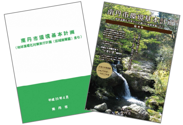
【南丹市環境基本計画と概要版】